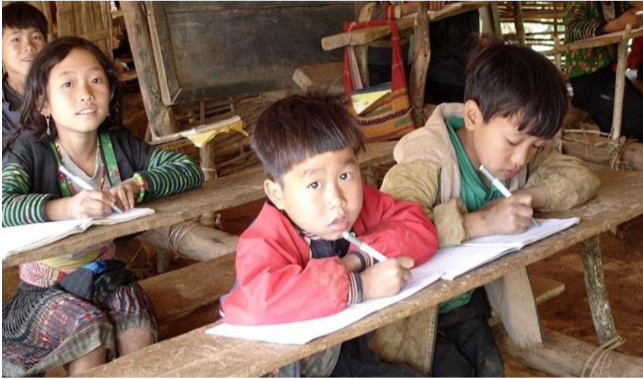
El desarrollo sostenible es un concepto complejo que hay que hacer efectivo para brindarles a nuestros niños un futuro seguro.

condiciones impuestas por la recesión mundial.