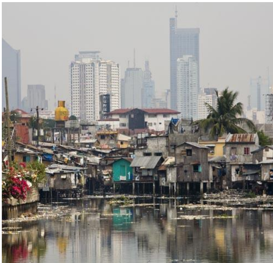
La coexistencia de viviendas precarias construidas en un ambiente insalubre y rascacielos modernos marca un contraste agudo que pone de manifiesto la pobreza y la desigualdad: dos problemas que deben ser prioridades de la agenda para el desarrollo.

Todos estarían de acuerdo con que el desarrollo es mucho más que la suma de todos los OMD o que cualquier otra suma arbitraria de una cantidad limitada de objetivos específicos. Sin embargo, es imposible llegar a un acuerdo internacional sobre todos los aspectos importantes del desarrollo económico y social y la protección del medioambiente. Cualquier acuerdo internacional sobre objetivos de desarrollo específicos sería inevitablemente selectivo y excluiría muchos aspectos que pueden revestir una importancia especial para numerosos países. Por estos motivos, en vez de centrar nuestros esfuerzos en definir objetivos selectivos específicos para las áreas de desarrollo económico y social y de protección del medioambiente, debemos apuntar a la creación de una atmósfera internacional favorable que