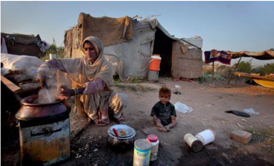
Algunas de las familias que viven en países en desarrollo viven en tugurios y cocinan en espacios abiertos. La erradicación de la pobreza debe constituir una preocupación central de los objetivos de desarrollo sostenible. Para posibilitar la aplicación de políticas a nivel nacional, deben abordarse los factores mundiales.

Este breve informe aborda los aspectos conceptuales de la erradicación de la pobreza en el marco de los objetivos de desarrollo sostenible.