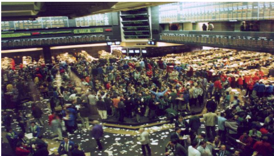
La especulación en los mercados de los productos básicos ha aumentado significativamente la volatilidad de los precios, lo que tiene efectos adversos en la seguridad alimentaria. El G77 y China piden en una declaración regular adecuadamente estos mercados.

agricultores y su desarrollo rural, aún no se ha llegado a un acuerdo sobre cómo hacer que estos principios se traduzcan en medidas y normas concretas. De ahí que otra de las metas u objetivos debe ser fijar cuanto antes medidas y normas concretas para hacer efectivo el principio que autorice a los países en desarrollo a tomar medidas para mejorar su seguridad alimentaria, los medios de vida de sus agricultores y su desarrollo rural en las normas multilaterales así como en otros acuerdos comerciales.