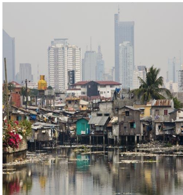
Pobreza y desigualdad: dos problemas que deben ser prioridades de la agenda para el desarrollo