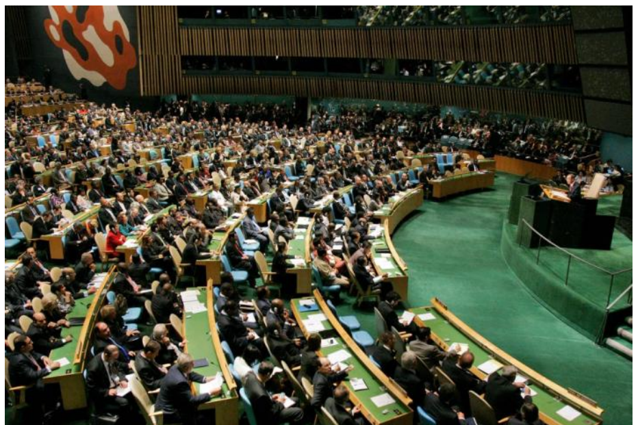
La reunión inicial del Grupo de trabajo de composición abierta sobre los objetivos de desarrollo sostenible tuvo lugar en el recinto de la Asamblea General de la ONU en Nueva York.

v. Crear y aplicar efectivamente un código de conducta multilateral y vinculante para garantizar la responsabilidad social y la rendición de cuentas de