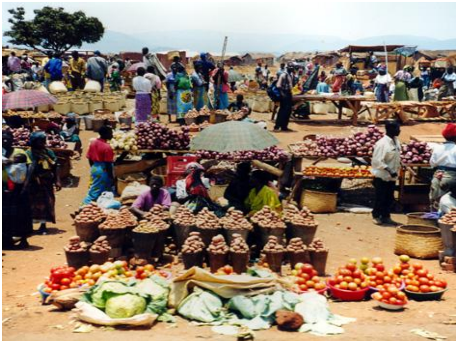
Los mercados de los pequeños agricultores son fundamentales para el suministro de alimentos a los consumidores comunes de los países en desarrollo.

2) un sistema de comercio favorable que incluya normas comerciales multilaterales y acuerdos comerciales regionales y bilaterales orientados a satisfacer las necesidades de los pobres en los países en desarrollo (como los pequeños agricultores y los sectores pobres de las poblaciones urbanas); en este sentido cobran especial importancia los objetivos como promover los medios de subsistencia de los pequeños agricultores, la seguridad alimentaria y el desarrollo rural y otorgar subvenciones a los agricultores de escasos recursos de los países en desarrollo;